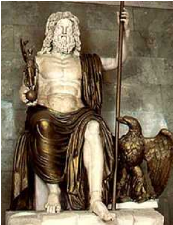
Zeus o Júpiter